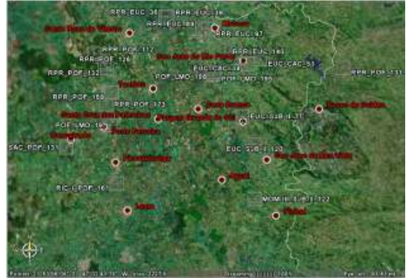
Figura 1 – Área de ocorrência

Desde o final dos anos 90 têm-se observado um crescente número de desligamentos fase-terra nas linhas de transmissão (LTs) de 138kV da CTEEP, na região nordeste do estado de São Paulo, com causas inicialmente desconhecidas. Na figura 1 estão representados os locais onde ocorreram desligamentos na área de atuação da CTEEP, entre os anos de 2002 a 2004.