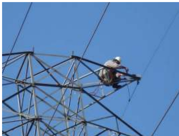
Figura 6 – Instalação de um dos receptores para testes em campo.

Para realizar os testes em campo foram instalados na linha de transmissão de 138kV da CTEEP Euclides da Cunha - Caconde, nas torres de transmissão de número 50 a 53. Em cada torre foram instalados um dispositivo luminoso ultravioleta e dispositivo sonoro, controlados por uma central microprocessada que é acionada remotamente através de uma comunicação via rádio com o transmissor. A figura 6 mostra a instalação dos dispositivos na mísula superior da torre de transmissão número 50.