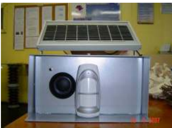
Figura 7 – Equipamento eletrônico repelente de pássaros.

Os resultados obtidos com o protótipo de testes nortearam o desenvolvimento do equipamento eletrônico repelente de pássaros. Desta maneira, este foi desenvolvido utilizando-se três módulos distintos: um sistema de detecção da presença de aves, sistema de disparo de alarme visual e sonoro e um sistema de geração e armazenamento de energia elétrica baseado em painéis solares, que terá por função fornecer a alimentação a todo o equipamento. Estes módulos estão integrados na mesma caixa metálica, de forma a proteger todo o circuito interno do equipamento. A figura 7 mostra o protótipo do equipamento. Apenas os dispositivos de luz estão localizados externamente ao equipamento, sendo instalados nas pontas das mísulas da torre e conectados via cabos.