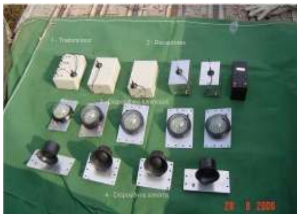
Figura 5 – Dispositivos do protótipo para testes em campo.

tivo sonoro. Os equipamentos que formam este sistema podem ser vistos na figura 5.