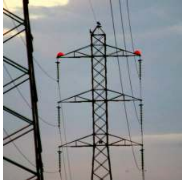
Figura 10 – Dispositivos anti pouso instalados em uma torre de transmissão.