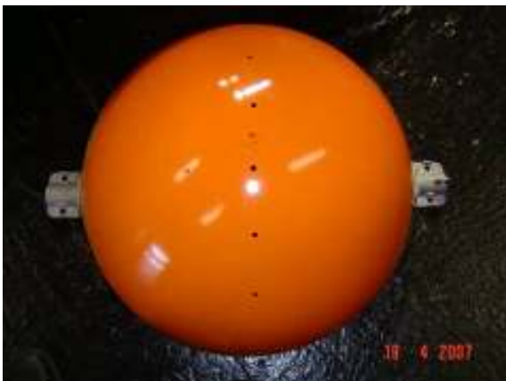
Figura 9 – Semi-esfera utilizada para impedir o pouso de curicacas sobre a cadeia de isoladores

Este dispositivo, que foi adaptado de um sinalizador de linha, conforme a figura 9, é composto por uma semi-esfera, que é posicionada na ponta da mísula superior da torre, conforme visto na figura 10.