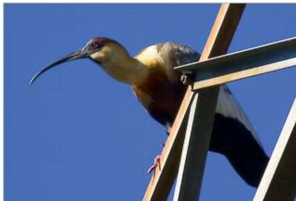
Figura 3 – Curicaca ( Theristicus caudatus )

Através de inspeções realizadas pela equipe de manutenção da CTEEP, verificou-se que muitos dos desligamentos nas linhas de transmissão são ocasionados por excrementos de pássaros, principalmente pelo Theristicus caudatus , conhecido popularmente pelo nome curicaca. Em vista disso, o projeto teve como primeira etapa um estudo dessa ave, com o intuito de conhecer as suas características sensoriais e comportamentais. Esta pesquisa foi necessária, pois apesar de ser uma premissa o fato que seria utilizado um dispositivo eletrônico sonoro, não estava descartado a utilização de qualquer outro tipo de estímulo capaz de repelir as aves, desde que se mostrasse eficaz.