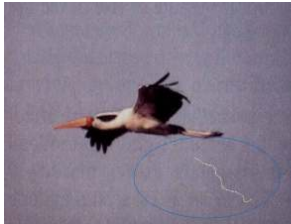
Figura 2 – bird-streamer

Após inspeções nas estruturas das torres das LTs atingidas, verificou-se que estes desligamentos são ocasionados por excrementos de pássaros, principalmente pelo Theristicus caudatus , conhecido popularmente pelo nome curicaca.