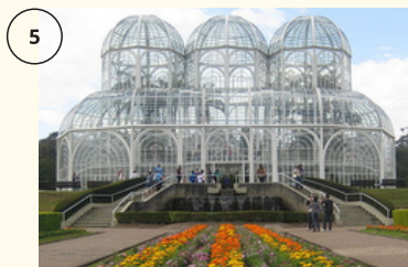
Ir ao parque

Em seguida, passe o exercício escrito "A".