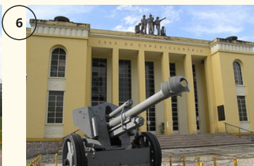
Ir ao Museu