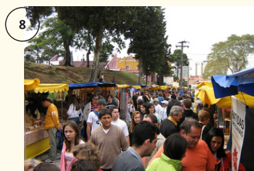
Ir à feira