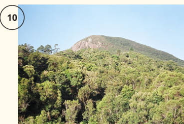
Escalar um morro