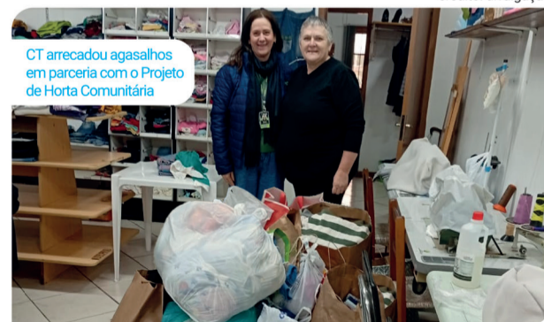
CT arrecadou agasalhos em parceria com o Projeto de Horta Comunitária