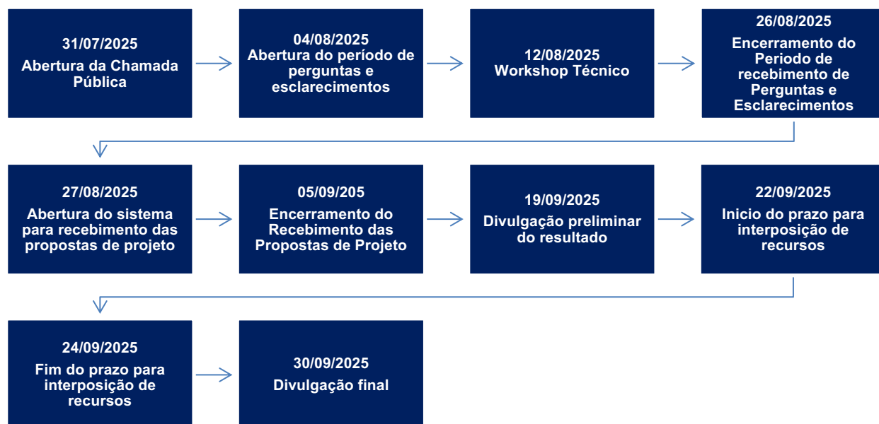
Figura 1 – Cronograma

2 Esse cronograma pode ser modificado, conforme resultado da análise de Projetos e as modificações comunicadas, sem prejuízos para o processo.