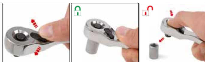
Dispositivo reversível de fácil acionamento.